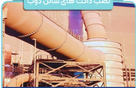
نصب داکت های سالن ذوب