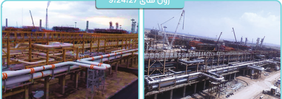
زون های 9،24،27