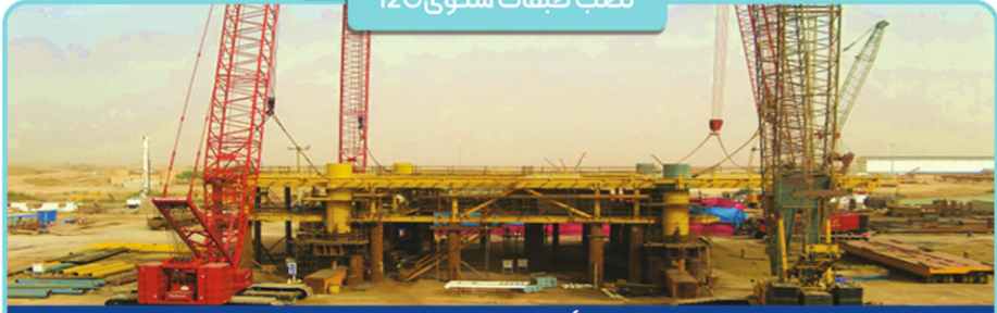
نصب طبقات سکوی 12C